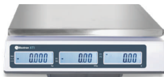
Trois écrans acheteur rétro-éclairés